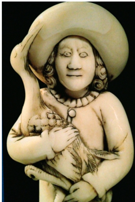
Hollander met kraanvogel. Olifantsivoor. c. 1770-80

http://www.sieboldhuis.org/hetsieboldhuis/siebold