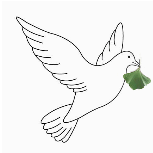
Heilige Geest met Ginkgo biloba blad, bewerking d o o rtje

Rood, blauw en groen zijn de kleuren van de drie-eenheid. Rood is God de Vader, blauw Gods zoon, groen is de kleur van de Heilige geest. Wanneer op een schilderij naast God de Vader en de Heilige Geest ook Maria te zien is, is de hiërarchie van de christelijke symboolkleuren anders. Maria draagt blauw. Het is echter niet het kostbare ultramarijnblauw, maar donkerblauw. Christus draagt rood, God de Vader draagt de purperen mantel. De heilige Geest, voorgesteld als een witte duif, tegen een groene achtergrond afgebeeld.