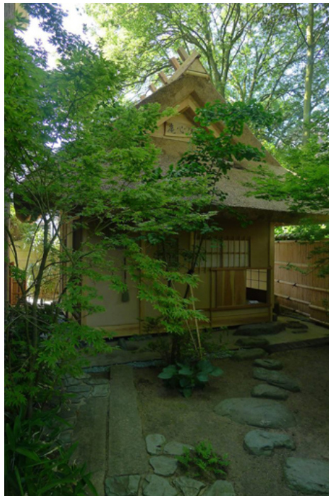
Theetuin met theehuis

En de tweede tip gaat over de jaarlijkse Japanmarkt op zondag 25 mei van 12.00 -17.00 uur op het Rapenburg in Leiden. Dit jaar staat de hele dag in het teken van miniatuur in de Japanse cultuur. Laat u inspireren door de Japanse liefde voor kleine dingen en bezoek de verschillende kramen voor met Japanse culturele en culinaire waren ! Voor meer info zie de site van Het Sieboldhuis http://www.sieboldhuis.org